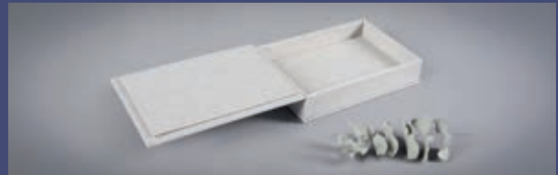
Foto box met fine art prints

Met of zonder Passe-Partout. Tarief € 95,-